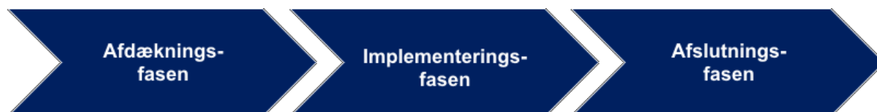
Figur 1. Indsatsområdernes 3 faser

Indsatsområderne er grundlæggende det, der skal få strategien ud over stepperne. Et konkret eksempel på et længerevarende indsatsområde er " Landsbyklynger ", som er en model for landsbyudvikling, der skal understøtte samarbejde på tværs af landsbyer. Målet er, på baggrund af en række forskellige samfundsrelevante problemstillinger, at vise nye veje til, hvordan dette samarbejde kan skabe grundlag for det gode liv på landet. Blandt andet i erkendelse af, at man ikke nødvendigvis har råd til både idrætshal, forsamlingshus og svømmehal i samtlige landsbyer, hvorimod det måske giver god mening at gå sammen i mindre klynger af landsbyer om at løfte opgaverne.