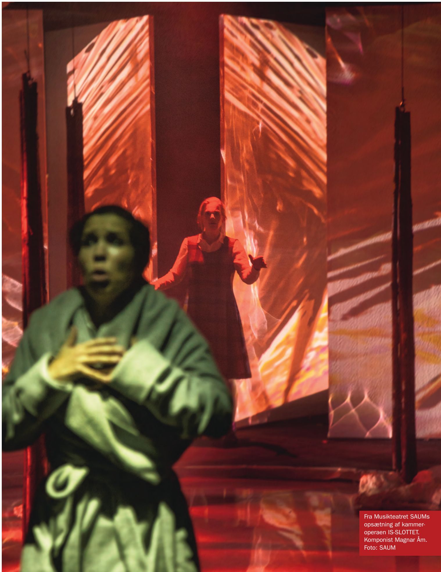
Fra Musikteatret SAUMs opsætning af kammer- operaen IS-SLOTTET. Komponist Magnar Åm.